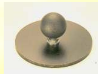
Klebebasis - rund Mit Klebescheibe für fast alle glatten Oberflächen.

Lieferbar mit Kugel 16mm oder 25mm: VM160521 mit Kugel 16 VM250521 mit Kugel 25