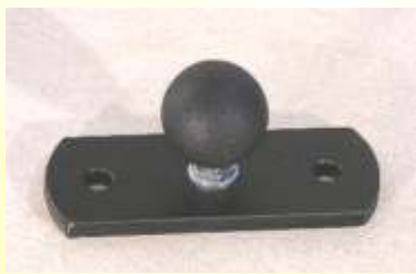
Anschraubsockel 80 Large - lang Äußerst stabiler, großer Sockel mit Montagebohrungen Länge ca. 80mm.

Lieferbar mit Kugel 16mm oder 25mm: VM160511 mit Kugel 16 VM250511 mit Kugel 25