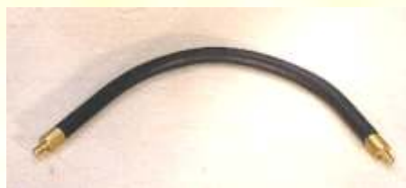
Flex Halter AG + AG Biegsam, diverse Längen Mit 2 Außengewinden (AG +AG). VM00501 1/4" AG + M6 AG, ca.16cm VM00511 1/4" AG + M8 AG, ca.16cm VM00601 1/4" AG + M6 AG, ca.30cm VM00611 1/4" AG + M8 AG, ca.30cm