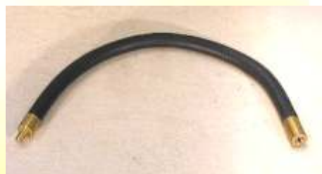
Flex Halter IG + AG Biegsam, diverse Längen. Mit Innen- und Außengewinde (IG + AG): VM00701 M6 IG + M6 AG, ca.16cm VM00711 M8 IG + M8 AG, ca.16cm