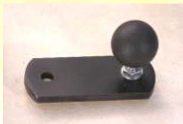
Auslegerarm gerade Mit Montagebohrung.

Lieferbar mit Kugel 16mm oder 25mm: VM160411 Länge 8cm, mit Kugel 16 VM250411 Länge 8cm, mit Kugel 25