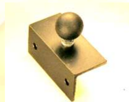
Winkelhalter Mit Montagebohrungen.

Lieferbar mit Kugel 16mm oder 25mm: VM160431 Länge 8cm, mit Kugel 16 VM250431 Länge 8cm, mit Kugel 25