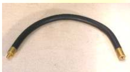
Flex Halter IG + AG Biegsam, diverse Längen. Mit Innen- und Außengewinde (IG+AG) VM00911 1/4" IG + 1/4" AG, ca.16cm VM00921 1/4" IG + 1/4" AG, ca.30cm